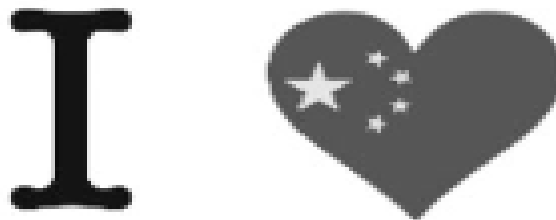
Figura 3 – I love China (Eu amo a China), versão B.

Fonte: GARCÍA, O., WEI, L. Translanguaging: Language, bilingualism and education . 1ª. ed., United Kingdom, Palgrave Macmillan Pivot, 2014,