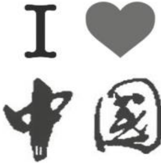
Figura 2 – I love China (Eu amo a China), versão A.