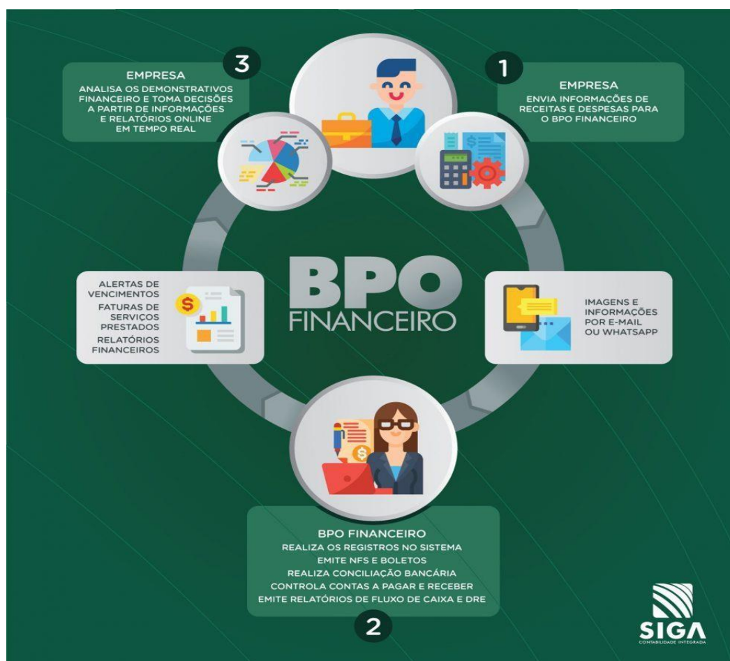
Figura 1: Ciclo Operacional