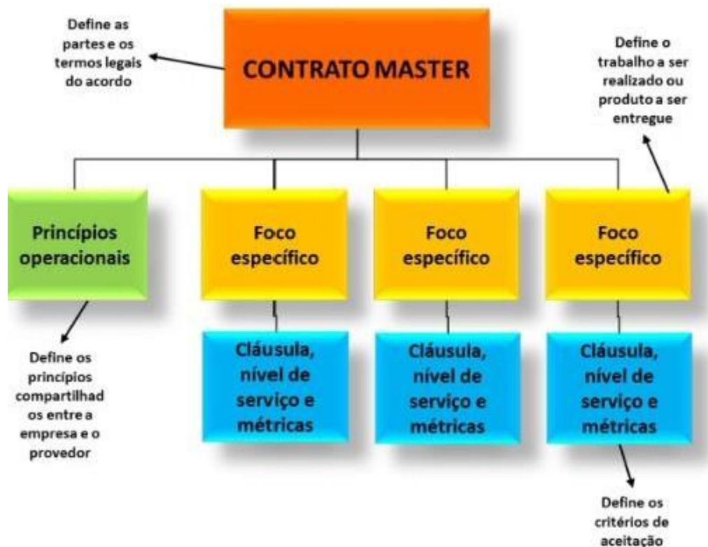
Figura 2: Base para um Contrato de Terceirização:

Como pontua Torres et.al. (2016) a preparação de um contrato de terceirização deve ter uma estrutura clara que relacione princípios, bases de trabalho, níveis de serviços e métricas associadas, como ilustra a figura a seguir: