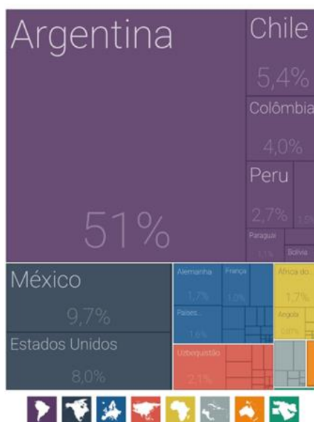
Figura 4. Destino das exportações brasileiras de partes e acessórios de produtos automotivos em 2023.

Já o resultado das exportações brasileiras de partes e acessórios de produtos automotivos manteve a Argentina como principal país de destino de seus produtos, como mostra a figura 4. Segundo dados do Comex Stat (2024), o valor FOB das exportações brasileiras da posição 8708 atingiram o valor de US$ 1.695 bilhões, tendo dessa forma um crescimento considerável de US$ 285 milhões de 2022 para 2023.