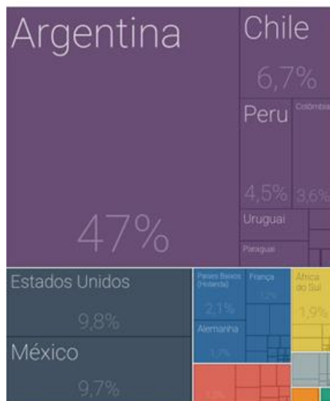
Figura 5. Destino das exportações brasileiras de partes e acessórios de produtos automotivos de janeiro a setembro de 2024.